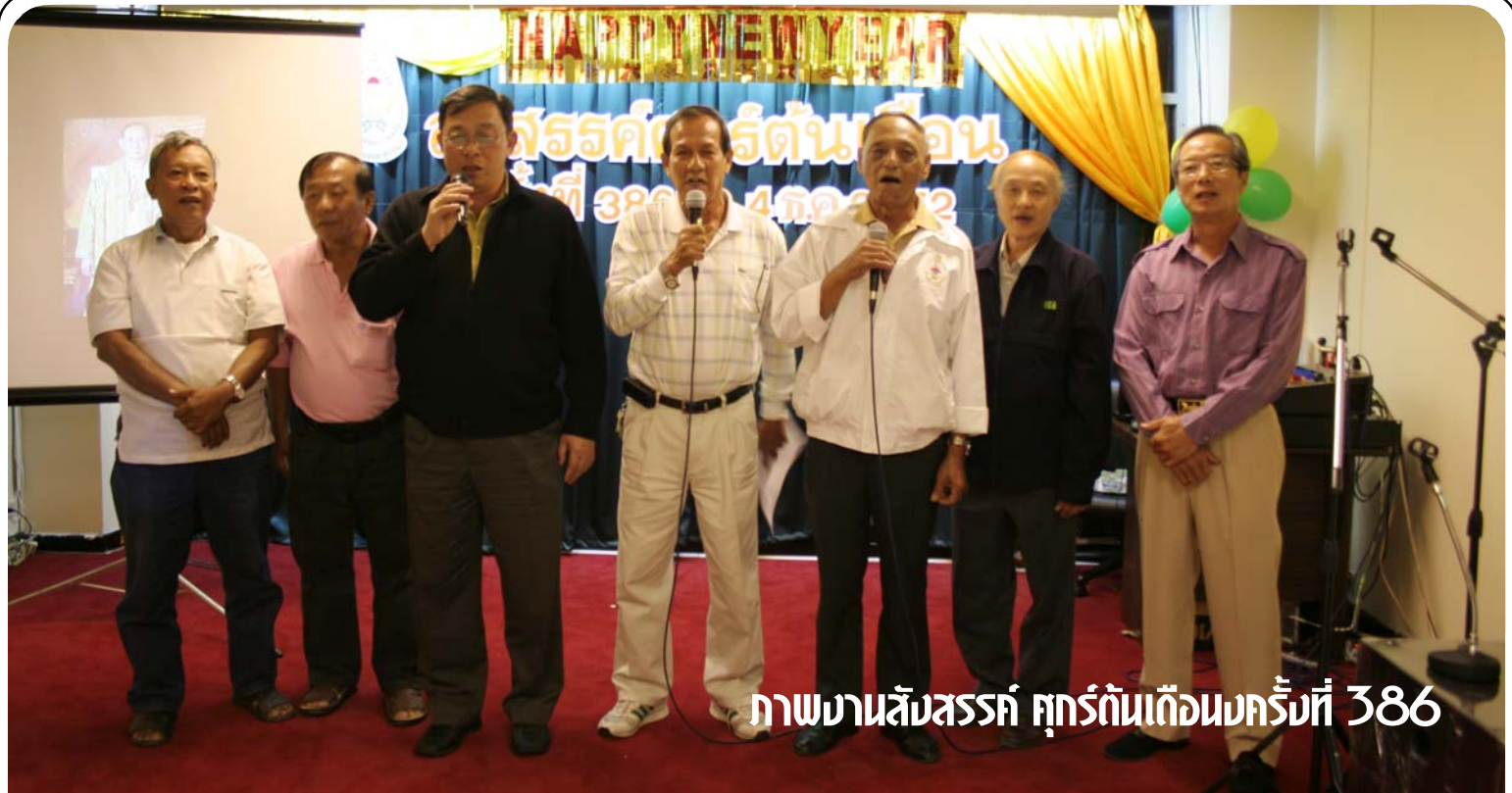
ภาพงานสังสรรค์ ศุภร์ต้นเดือนครั้งที่ 386