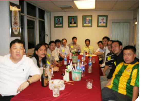
ฉลองปีใหม่ 2553 ในงานศุภร์ต้นเดือน วันศุภร์ที่ 8 มกราคม 2553 เออากับเกมส์สนุกและโชว์พิเศษ ที่สโมสรนักเรียนเก่าเทพศิรินทร์ อาคารมณียาเซ็นเตอร์ นอร์ท ชั้น 5 ถ.เพลินจิต (BTS ชิดลม)

ข่าวสารจากสมาคมนักเรียนเก่าเทพศิรินทร์สำหรับลูกแม่รำแพย