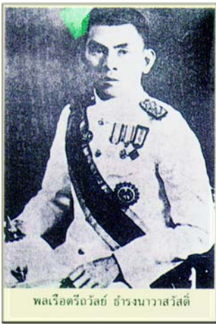
พลเรือตรีถวัลย์ อ่างรณาวาสวัสดิ์

เนื่องในวันที่ 3 ธันวาคม 2554 ขอย้อนรำลึก 23 ปีการถึงแก่อสัญกรรม พลเรือตรีถวัลย์ อ่างรณาวาสวัสดิ์ หรือ หลวงอ่างรณาวาสวัสดิ์ นายกรัฐมนตรีคนที่ 8 ของประเทศไทย และอดีตนายกสมาคมนักเรียนเก่าเทพศิรินทร์ ฯ