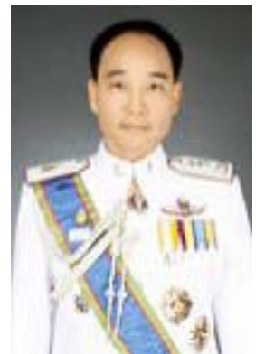
พล.ต.ต.ศตวรรษ หิรัญบุรณะ

■ เมื่อวันที่ 25 ธันวาคม 2554 มีมติให้ความเห็นชอบการคัดเลือก แต่งตั้งข้าราชการตำรวจดำรงตำแหน่งระดับผบก.-รองผบช. จำนวน 235 ราย ซึ่งขณะนี้อยู่ระหว่างดำเนินการเพื่อนำความกราบบังคมทูลเพื่อทรงพระกรุณาโปรดเกล้าแต่งตั้ง ปราบกฏว่า