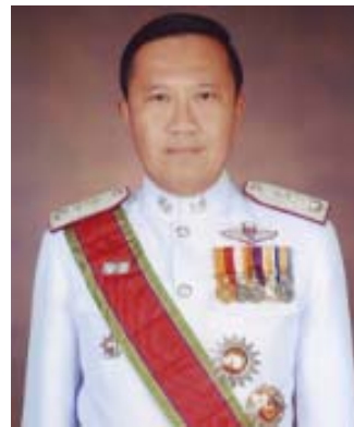
พล.ต.ต.พิสิฎฐ์ พิสุทธิศักดิ์